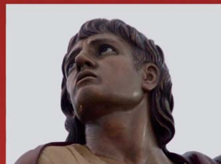
San Juan, Paso Cristo del Amor de la Cofradía de los Dolores.