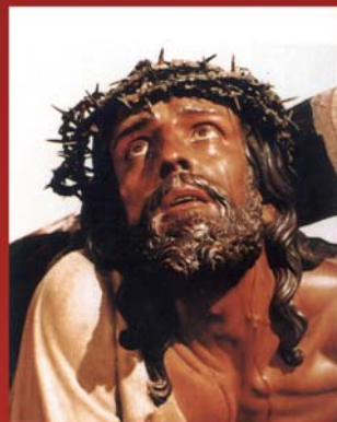
La Tercera Caída, Parroquia de San Román de la Llanilla.