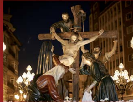
Paso de El Descendimiento, de la Cofradía del Descendimiento.