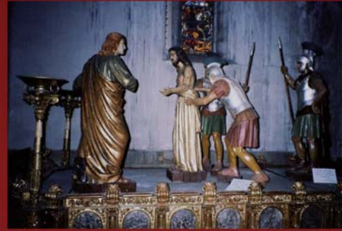
Paso de El Expolio, de la Cofradía de los Dolores.

centenario de nacimiento de Víctor de los Ríos Campos