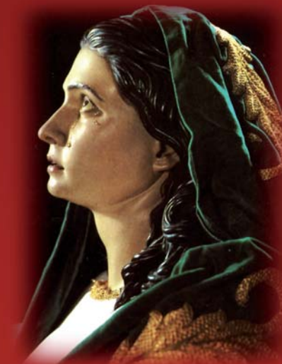
1959 CINCUENTENARIO 2009 de la Virgen de La Esperanza