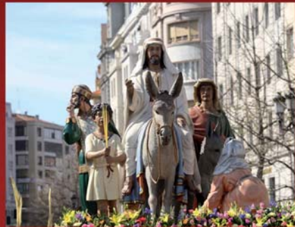
Paso de La Entrada en Jerusalén, de la Cofradía del Descendimiento.