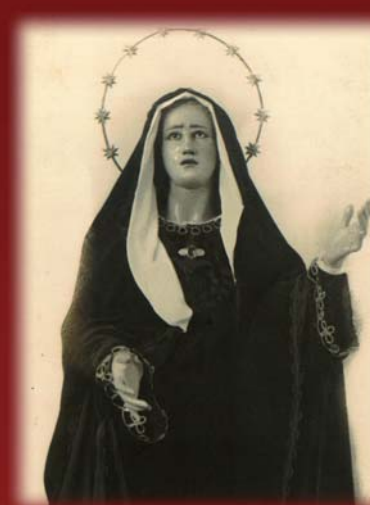
1909 CENTENARIO 2009 de la Virgen de la Amargura