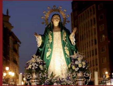
Virgen de la Esperanza, de la Cofradía de la Esperanza.