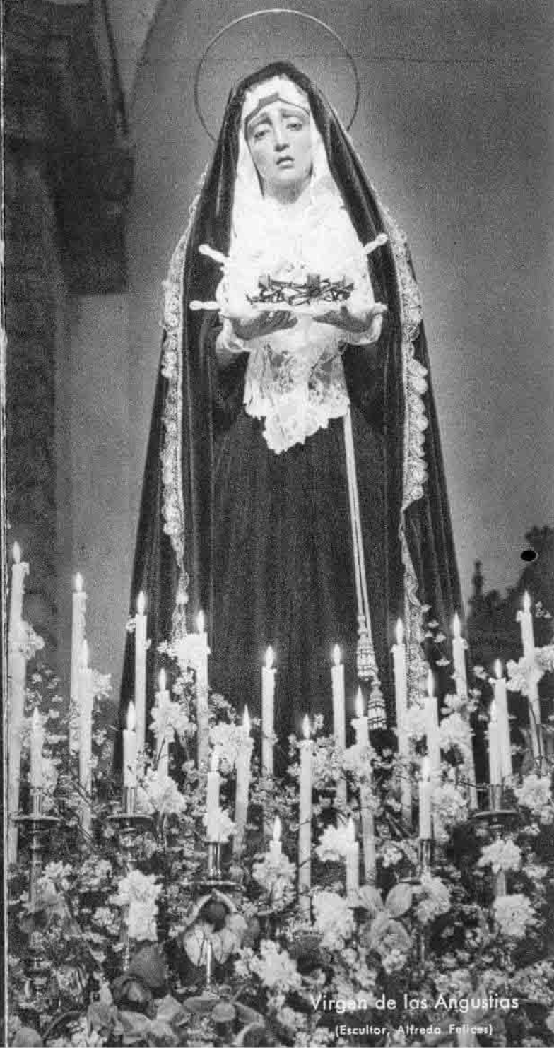
Virgen de las Angustias (Escultor: Alfredo Felices)