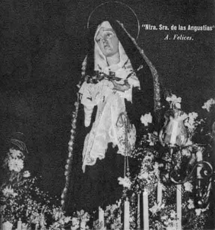
"Ntra. Sra. de las Angustias"