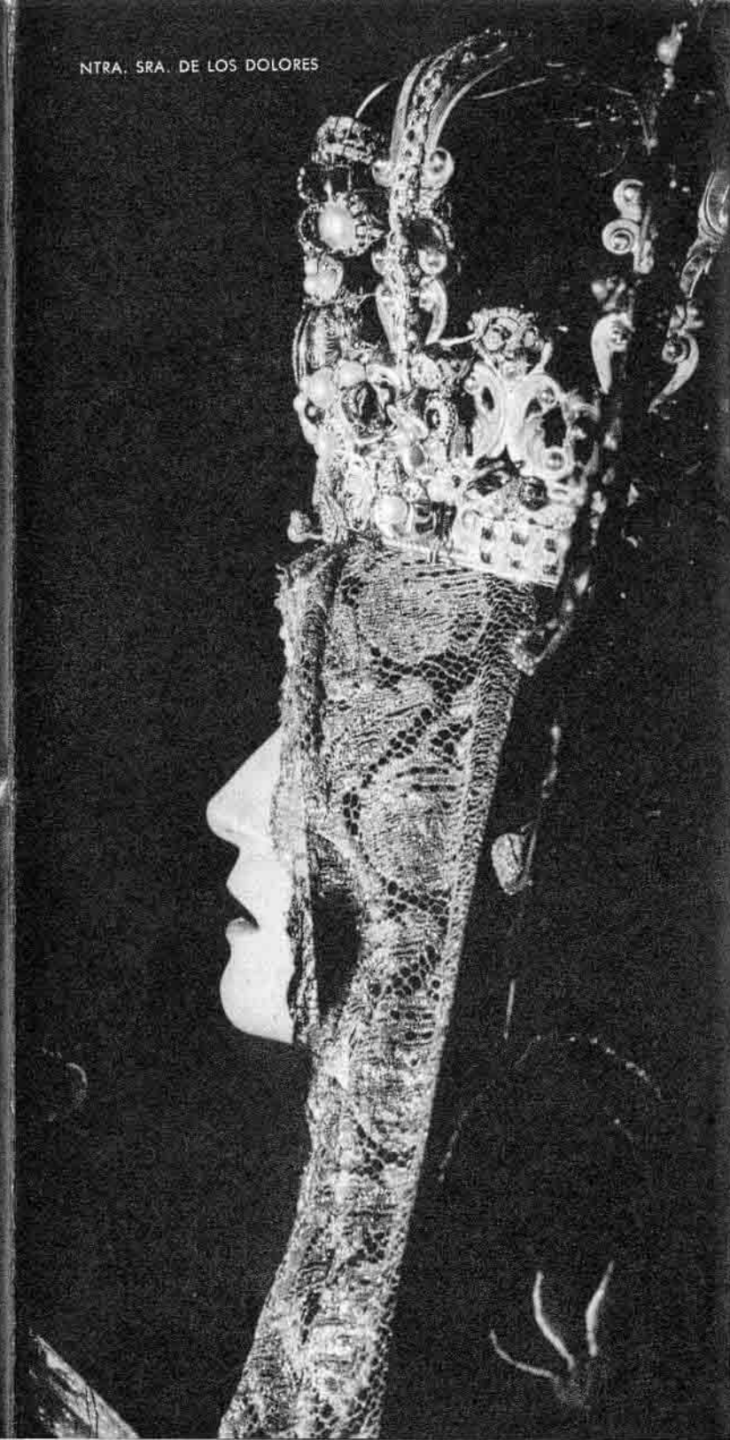
NTRA. SRA. DE LOS DOLORES