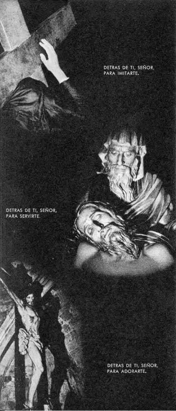
DETRAS DE TI, SEÑOR, PARA IMITARTE.