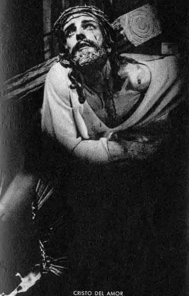
CRISTO DEL AMOR