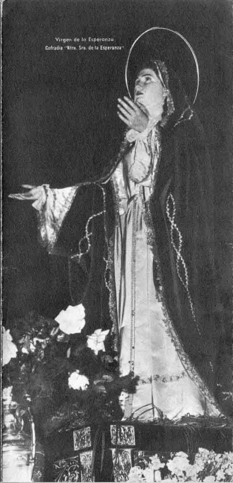
Virgen de la Esperanza Cofradía "Ntra. Sra. de la Esperanza"